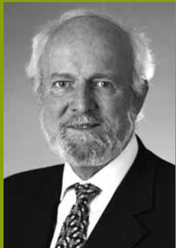
Prof. Dr. Ernst Ulrich von Weizsäcker